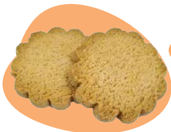
28 SABLÉS AMANDE Sablé aux amandes saveur amande Poids net : 350g Prix : 12€ (34.29€/kg)