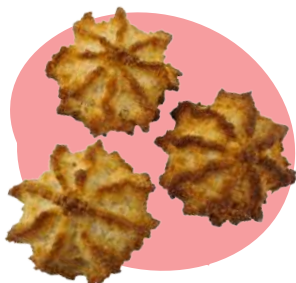
27 ROCHERS COCO Rocher à la noix de coco Poids net : 350g Prix : 12€ (34.29€/kg)

Nos incontournables biscuits emballés individuellement pour un moment de plaisir n'importe quand dans la journée.