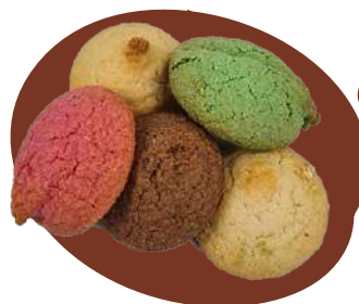
29 MACARONS ASSORTIS Assortiment de macarons melleux aux amandes, au chocolat, saveurs pistache, framboise et citron Poids net : 350g Prix : 12€ (34.29€/kg)