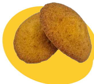
30 MADELEINES Madeleine pur beurre Poids net : 350g Prix : 12€ (34.29€/kg)